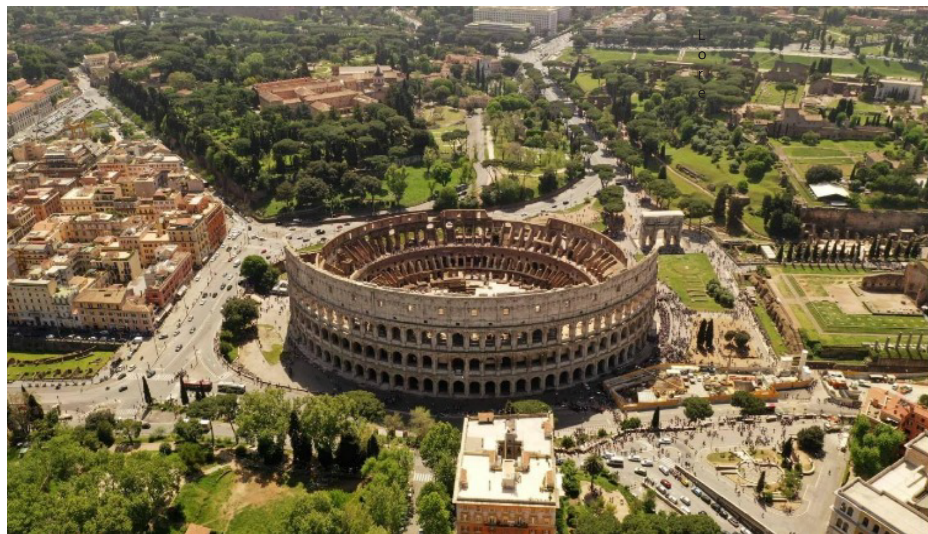
Figura 1. Teatro romano (Roma) – Morphosis.

A continuación, se explicarán tres casos que ilustran la importancia de la arqueología en la arquitectura, así como las estrategias y técnicas utilizadas a lo largo de la historia para abordar la restauración de edificaciones arquitectónicas.